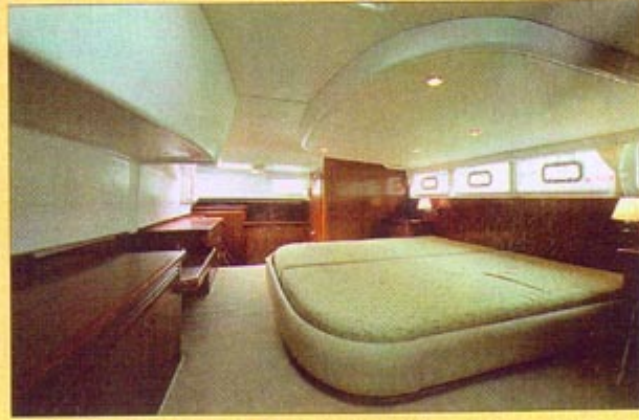
Sur l'arrière, la cabine de propriétaire, qui occupe toute la largeur du bateau, est notamment garnie d'un lit king size en son centre.