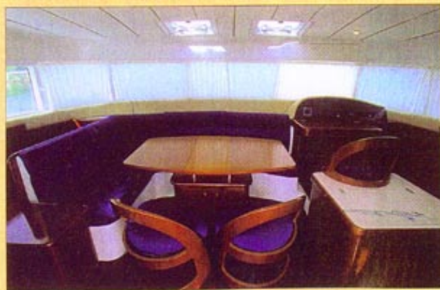
Pourvu d'une vue panoramique sur 180 degrés, le carré propose une banquette en L, une table avec rallonge et deux fauteuils.

flybridge, bien protégé par un pare-brise inversé, proposant deux banquettes trois places, plus un strapontin. Assez reculée, la console de pilotage permet de barrer, aussi bien debout qu'assis. Un bain de soleil (2,10 x 1,25 m) occupe la partie arrière. Une double porte vitrée